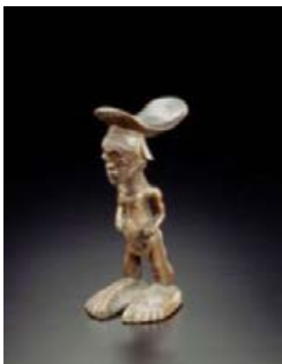
Antropomorfe hoofdsteun / Appuie-tête anthropomorphe / Anthropomorphic headrest. Kasaï, RD Congo. [Luluwa]. Late 19th-early 20th century. Wood ( Crossopterix febrifuga), pigment. Acquired by CICM congregation. Gift. 1914. EO.0.0.18802, collection RMCA Tervuren

onderzoek naar deze vroege collectie bracht de diverse netwerken in kaart van de mensen die direct of indirect bij de verwerving betrokken waren. Het overgrote deel van deze objecten werd verkregen in een context van ongelijke machtsrelaties en / of geweld, waarin Congolese gemeenschappen erg weinig handelingsvrijheid bezaten.