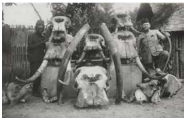
Mise-en-scène met schedels van olifanten / Mise en scène avec installation de crânes d'éléphants / Mise-en-scène with skulls of elephants ( Loxodonta cyclotis). Moma region, Équateur, RD Congo. s.d. Gift. 1935.