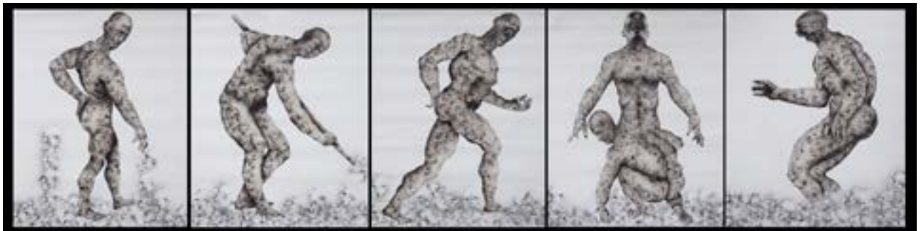
Géraldine Tobe (Congolese, Kinshasa, 1992, lives and works in Kinshasa). Le Cri de L'âme . (De kreet van de ziel / The cry of the soul). From 'Kalunga' series. 2021. Smoke on canvas. © G. Tobe for the artwork, photo and © Jeanpy Kabongo

Door de band met het cultureel erfgoed te herstellen wil de Congolese kunstenares Géraldine Tobe de voorouderlijke spiritualiteit nieuw leven inblazen. Voor het project 'Esprit des Ancêtres' onderzocht ze aan de hand van Congolese culturele objecten in Europese musea de prekoloniale Afrikaanse spirituele identiteit. Tobe vertaalt de verhalen van objecten naar kunstwerken, om zo een nieuwe collectieve verbeelding te stimuleren. Jonge Afrikanen kunnen zich opnieuw verbonden voelen met hun voorouders en culturele geschiedenis. Het project staat in het teken van verzoening, herstel en her-verbinding, zowel op fysiek als spiritueel niveau.