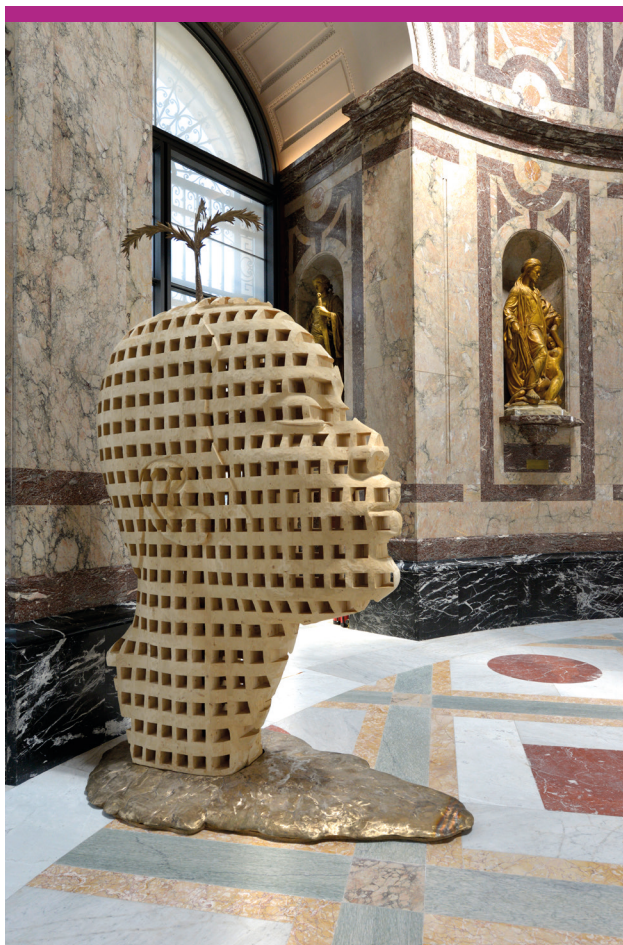
Aimé Mpane (1968 - )

Beeldhouwwerk in de grote rotonde, besteld door het museum. Coll. KMMA, Tervuren -inv. 2017.7.1