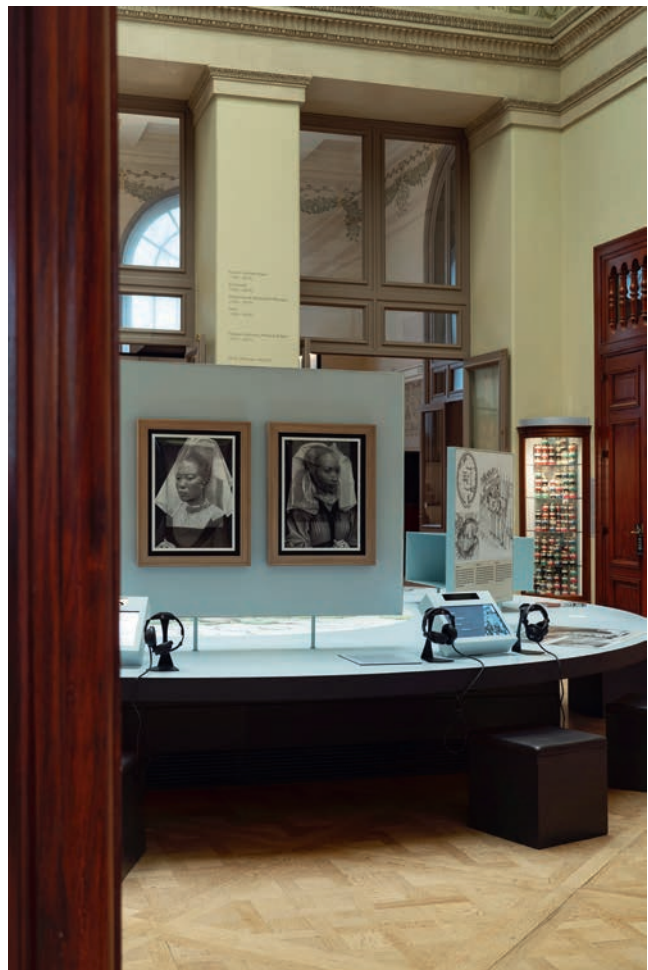
Zicht op de zaal AFROPEA @ MRAC - KMMA