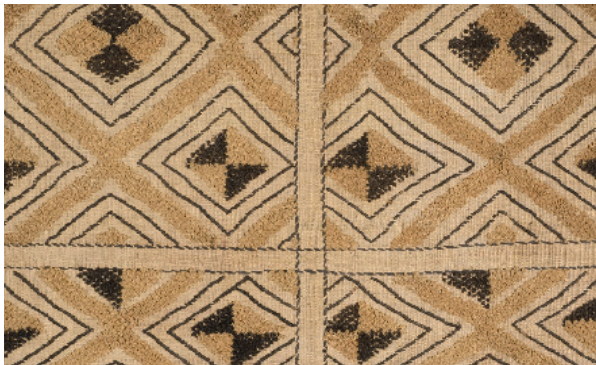
Kuba-textiel. EO.1980.2.2779

De Kuba-textielen vormen het vertrekpunt voor het verkennen van vier centrale thema's: de productiewijze van raffiatextiel, de sociale en koninklijke betekenissen van patronen, de manier waarop musea deze objecten documenteren en presenteren, en de hedendaagse voortzetting van dit ambacht in een geglobaliseerde context.