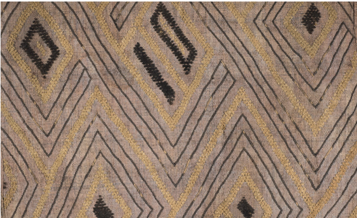
Kuba-textiel. EO.1980.2.2787