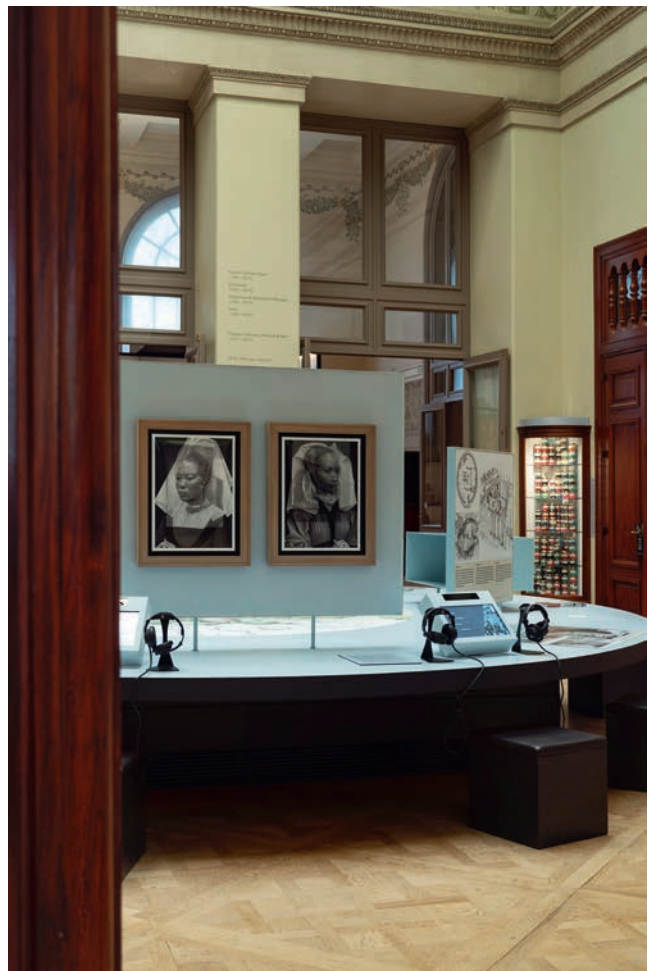
Vue sur la salle AFROPEA @ MRAC - KMMA