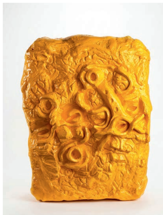
Sculpture Time and Motion de la série A Cycle Game , de Dieex Bitegets. Bilal Arty @ MRAC - KMMA