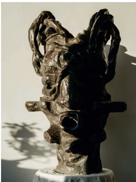
Sculpture Chaotic Symphony de la série Expressions à travers les profondeurs , de Dieex Bitegets.

Quand : visite guidée le 7 juin; expo ouvert du 2 juin 2026 au 30 mai 2027