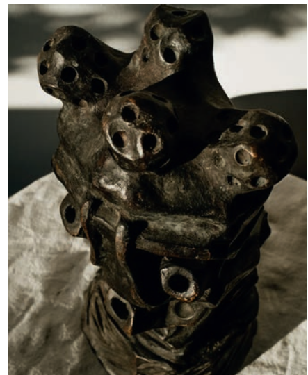
Sculpture «Horizontality of Things» de la série Expressions à travers les profondeurs , de Dieex Bitegets.

Le second volet, Expressions à travers les profondeurs , comporte dix bronzes insufflés par l'intuition et un mouvement intérieur. Les titres des œuvres et les poèmes qui les accompagnent sont en néerlandais, en anglais, en lingala et en swahili. Ce multilinguisme renvoie au monde stratifié au sein duquel l'artiste navigue et qui sans cesse donne forme à son identité plurielle.