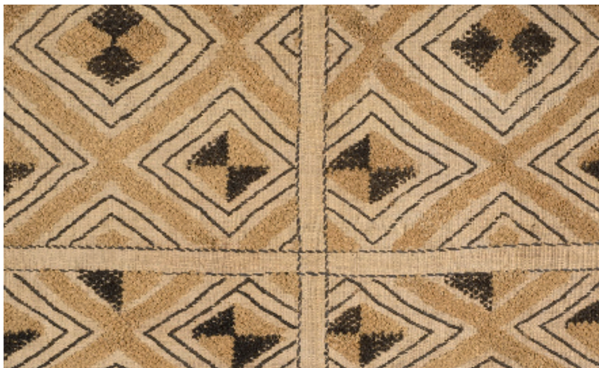
Textile kuba. EO.1980.2.2779

À partir des textiles kuba, l'équipe de Gestion des collections explore quatre grands thèmes : la fabrication du textile de raphia, les significations sociales et royales qui se dissimilent dans les motifs, la documentation et la présentation de ces objets au sein des musées et la survie de cet artisanat à l'heure de la mondialisation.