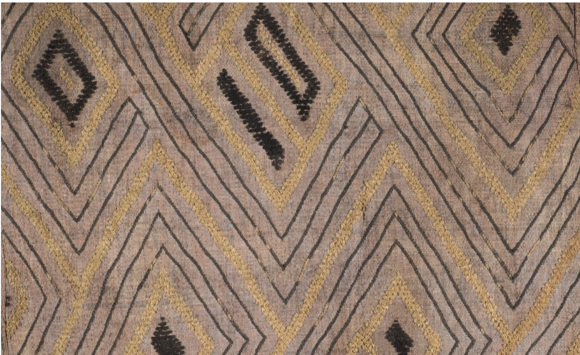
Textile kuba. EO.1980.2.2787